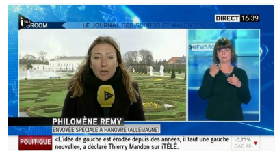
le journal télévisé traduit en LSF