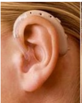
un appareil auditif