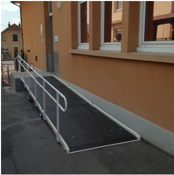
une rampe d'accès

Reliez chaque photo avec le symbole du handicap, comme dans l'exemple :