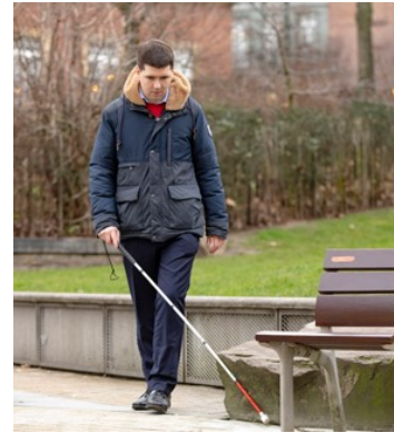
une canne blanche