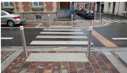
la surface podotactile et les poteaux blancs