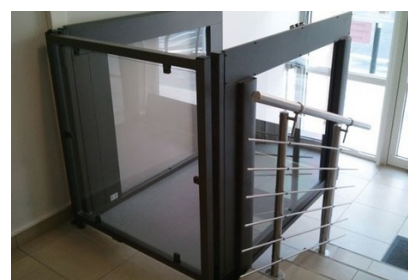
une plate-forme élévatrice